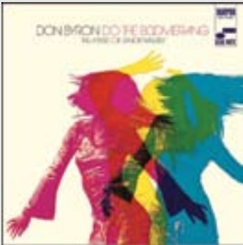
DON BYRON «Do The Boomerang. The Music of Junior Walker»

Рецензенты оценивают альбомы по классической пятибалльной шкале: 5 звезд — шедевр, 4 — отличная работа, 3 — хорошая работа, 2 — хорошо, но скучно, 1 — не стоит затраченного времени. Оценка рецензента субъективна и не обязательно совпадает с оценкой редакции, других рецензентов и, тем более, слушателей.